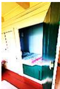
Bedwantsen in de bedstee...?

“Hier zitten geen bedwantsen” zei de aardige meneer, “de dochter van jullie gasten heeft bulten van muggebeten (langpoaten, miggen) opgelopen. Kijk, hierboven zitten de langpoaten” en hij scheen met zijn zaklamp naar boven. Je zou kunnen zeggen: wat jammer nou, nu krijgen we dus geen bedwantsen te zien. Maar wij waren heel blij en nog meer opgelucht.